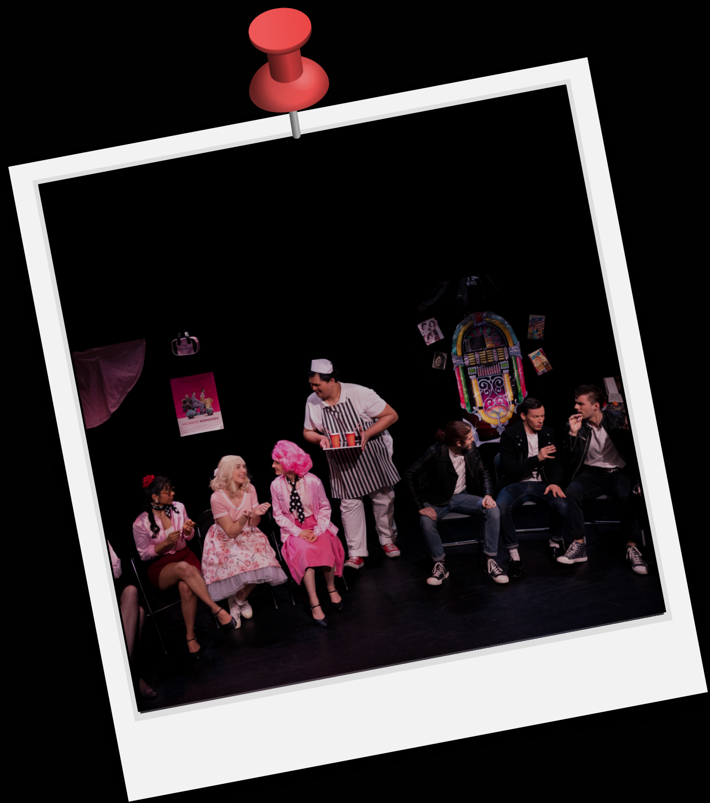
PHOTO D'UNE REPRÉSENTATION DE "GREASE" PAR LA COMPAGNIE UN VERRE DE BROADWAY À L'ESPACE 44. CETTE PIÈCE A PU ÉGALEMENT ÊTRE JOUÉE DANS L'EHPAD KORIAN SITUÉ À GERLAND. LA LUTTE CONTRE L'ISOLEMENT ET PLUS PARTICULIÈREMENT LA CRÉATION DE LIEN SOCIAL SONT DES OBJECTIFS DU COLLECTIF. POUR DÉVELOPPER CES OBJECTIFS, L'ASSOCIATION CHERCHE À DONNER DES REPRÉSENTATIONS DANS DES ESPACES DÉDIÉS AUX PERSONNES ÂGÉES (EHPAD, LIEUX INTERGÉNÉRATIONNELS).

POUR LE ROCKY HORROR PICTURE SHOW, NOUS SOUHAITERIONS RÉCOLTER LES FONDS DE CERTAINES DE NOS REPRÉSENTATIONS POUR DES ASSOCIATIONS VENANT EN AIDE AUX PERSONNES LGBTQIA+ DANS LE BESOIN.