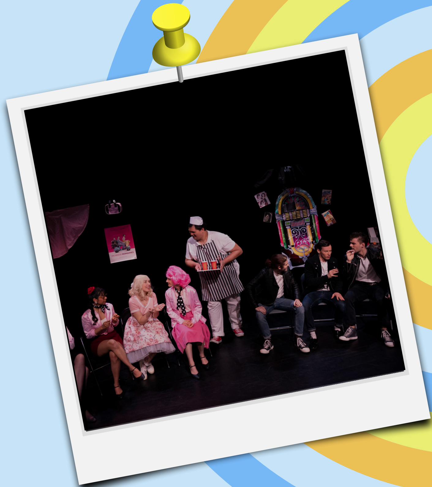
Photo d'une représentation de "Grease" par la compagnie Un verre de Broadway à l'espace 44. Cette pièce a pu également être jouée dans l'Ehpad KORIAN situé à GERLAND. La lutte contre l'isolement et plus particulièrement la création de lien social sont des objectifs du collectif. Pour développer ces objectifs, l'association cherche à donner des représentations dans des espaces dédiés aux personnes âgées (Ehpad, café intergénérationnel).

Soirée magie et comédie musicale le 21/05/2022 avec une représentation de "Grease" par la compagnie un Verre de Broadway et la partie magie assurée par le magicien William Arribart. Spectacle caritatif pour l'Association l'Orchidée qui réalise les projets des enfants gravement malades.